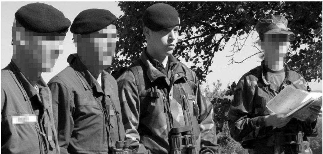
Immagine 1: cadetti ufficiali nazionali e internazionali durante l'addestramento alla leadership sulle operazioni di gestione delle crisi. 5

Il testo del saggio che segue questa descrizione deve essere separato da essa premendo una volta il tasto "enter". Per esempio